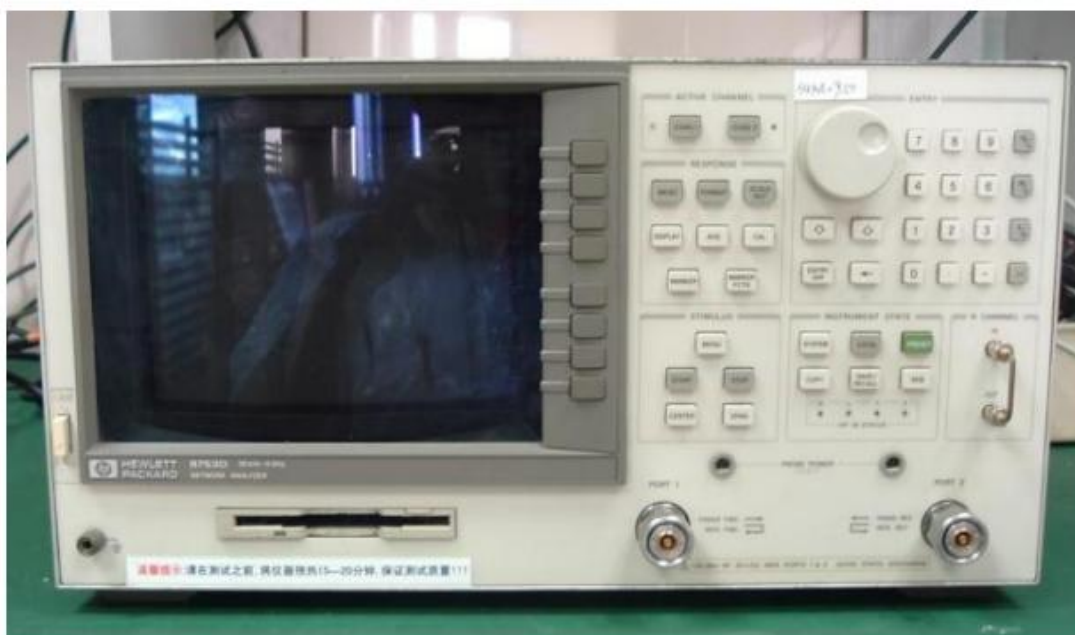
天线测量网络分析仪